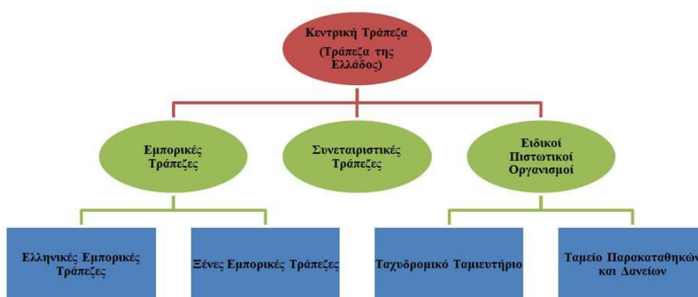
Εικόνα 1:

Το τραπεζικό σύστημα στην Ελλάδα αποτελείται από την Κεντρική- Εκδοτική Τράπεζα όπου είναι η κεντρική τράπεζα της Ελλάδος όπου ιεραρχικά είναι η επικεφαλής των τραπεζών και ακολουθούν υπό την εποπτεία της οι ενδιάμεσοι χρηματοδοτικοί οργανισμοί, οι εμπορικές τράπεζες, οι συνεταιριστικές και οι ειδικοί πιστωτικοί οργανισμοί. (Π.Ε Πετράκης, 2003)