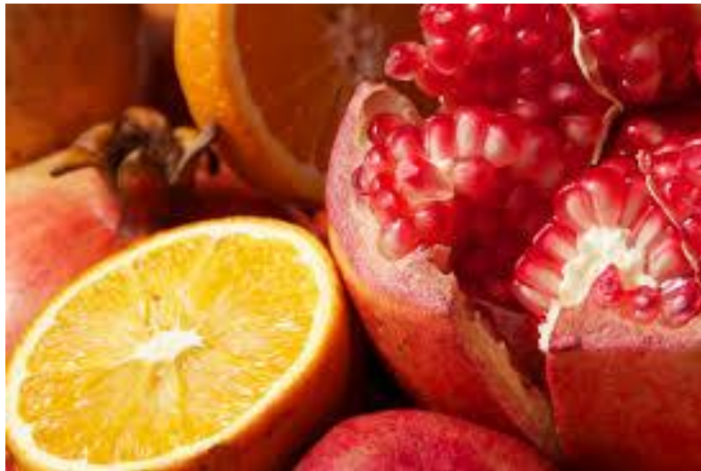
Φρούτα του χειμώνα

Την όγδοη εβδομάδα θα παρουσιαστεί εντός της σχολικής τάξης ο πρώτος ζωγραφικός πίνακας, ενώ την ένατη εβδομάδα θα παρουσιαστεί στην τάξη ο δεύτερος εξ αυτών. Αντίστοιχα, τη δέκατη εβδομάδα θα παρουσιαστεί εντός της σχολικής τάξης η πρώτη φωτογραφία, ενώ την ενδέκατη εβδομάδα θα παρουσιαστεί στην τάξη η δεύτερη εξ αυτών. Οι ζωγραφικοί πίνακες και οι φωτογραφίες θα αποτελέσουν εφαλτήριο για τη συζήτηση που θα ακολουθήσει στη σχολική τάξη, μέσα από την οποία τα παιδιά θα μάθουν