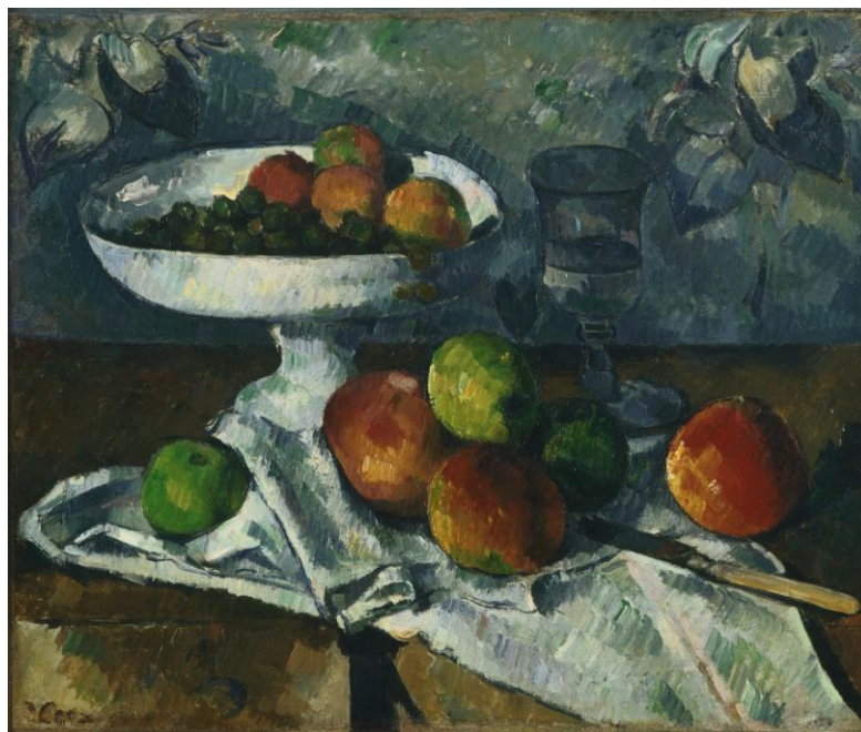
Paul Cezanne, Still Life with Fruit Dish, 1879-80 ΜΟΜΑ, Ελαιογραφία σε καμβά