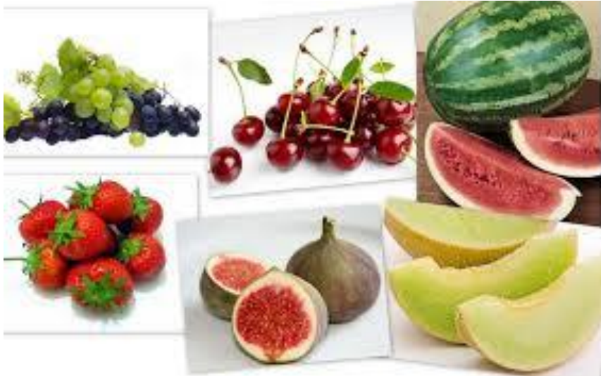
Φρούτα του καλοκαιριού