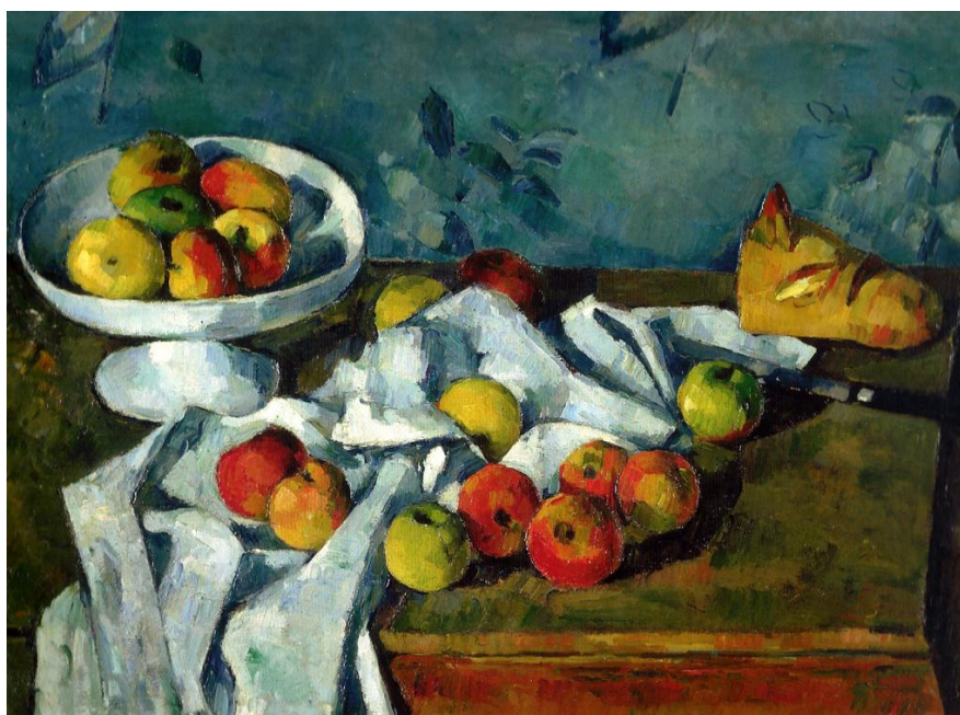
Paul Cezanne, Still Life with Fruit Dish, Apples and Bread, 1880

Oskar Reinhart Art Collection Winterthur, Switzerland, Ελαιογραφία σε καμβά