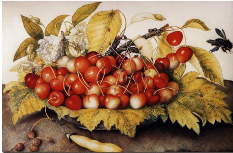
Giovanna Garzoni, Cherries in a Dish, a Pad and a Bumblebee, περ. 1642-51

Γκαλερί Paletina, Φλωρεντία, Γκούας σε περγαμνή