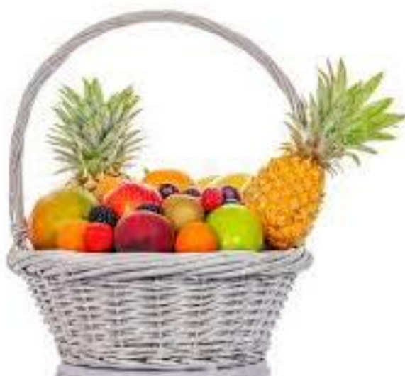
Καλάθι με φρούτα