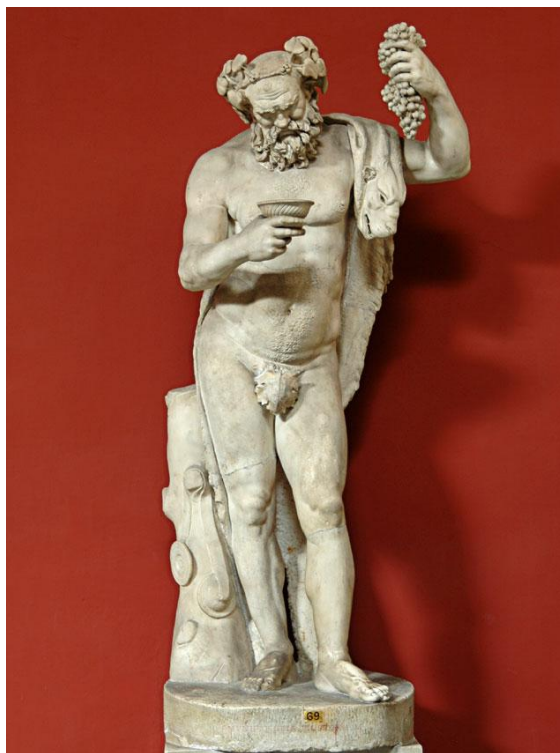
Βάκχος, Ελληνιστική περίοδος Μουσεία Βατικανού, Μουσείο Ριό-Celementino