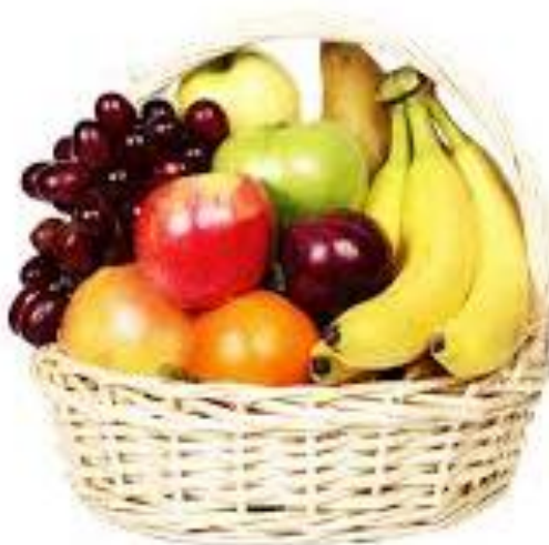
Καλάθι με φρούτα