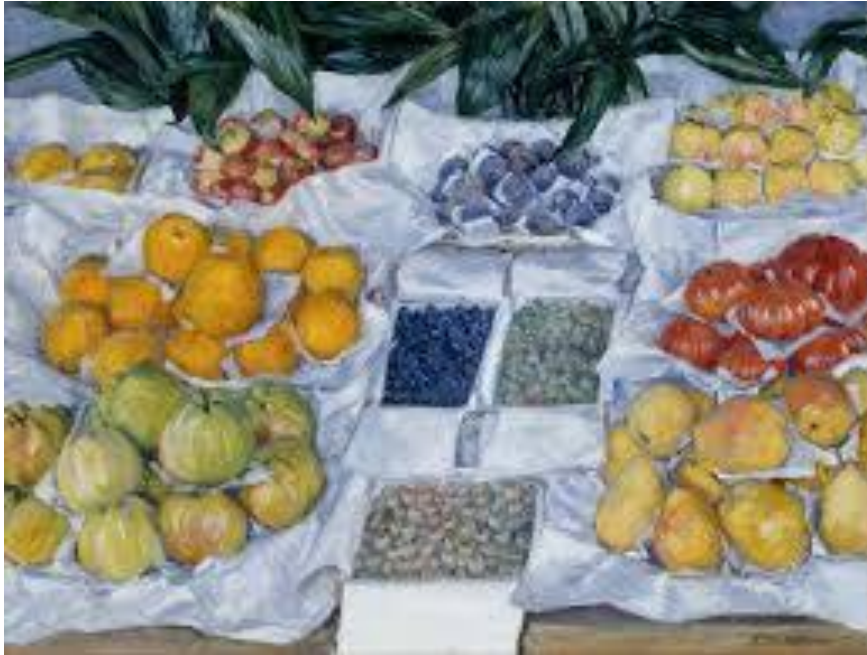
Gustave Caillebotte, Fruit Displayed on a Stand, περ. 1881-82 Μουσείο Καλών Τεχνών, Βοστώνη, Ελαιογραφία σε καμβά