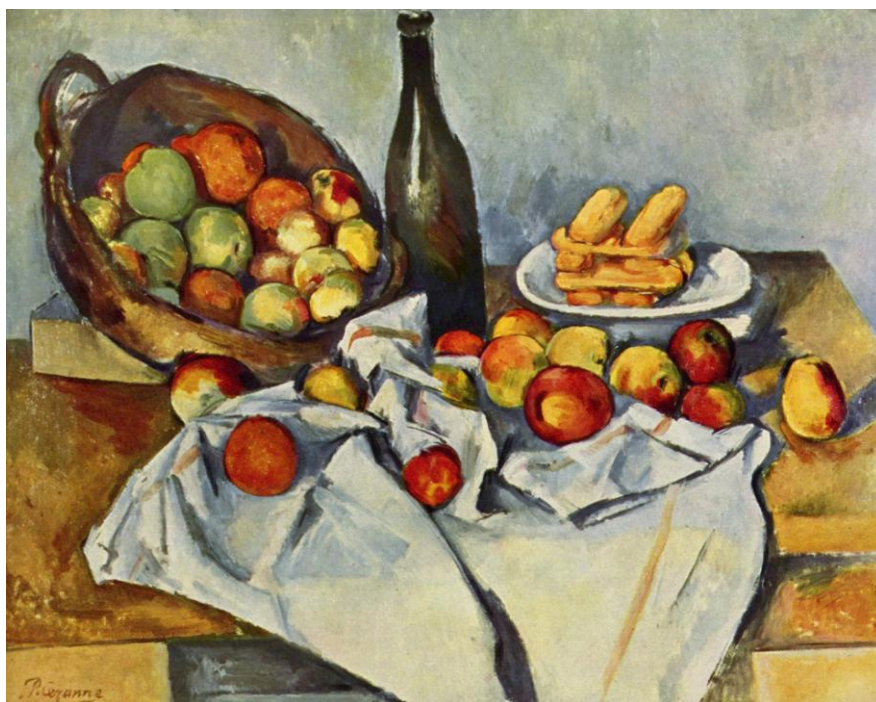
Paul Cezanne, Το καλάθι με τα μήλα, 1895 Art Institute of Chicago, Ελαιογραφία σε καμβά