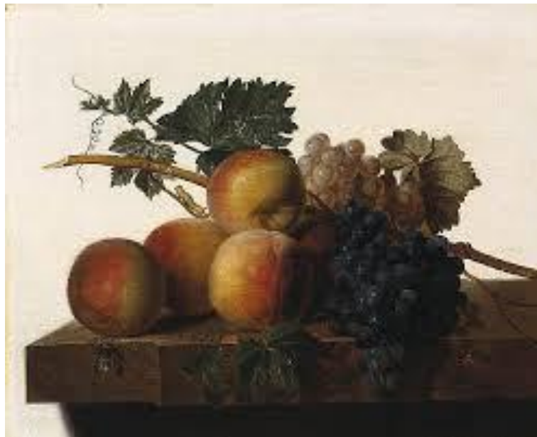
John Johnston, Νεκρή φύση, 1810

Saint Louis Art Museum, Missouri, Ελαιογραφία σε πάνελ