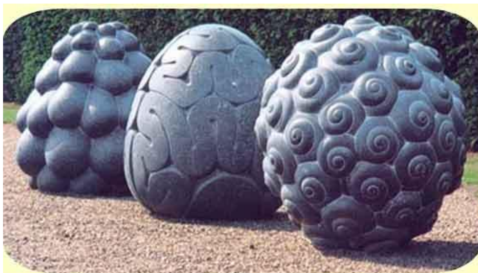
Peter Randal, Fruits of Mythic Trees, 1992