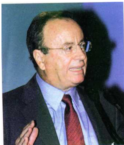
Ο Βασίλης Κοντογιαννόπουλος παραιτήθηκε από υπουργός Παιδείας στις αρχές του 1991 ύστερα από μια μακρά περίοδο καταλήψεων των σχολείων από τους μαθητές.

Μαζί με την επίδοση στις Γενικές Εξετάσεις, συνεκτιμάτο σε συνολικό ποσοστό 257ο η επίδοση στις τρεις τάξεις του λυκείου. Από το 1988 καταργήθηκε η βαθμολογία του λυκείου ως συντελεστής εισαγωγής, καθιερώθηκε βασικό μάθημα σε κάθε δέσμη, το οποίο και πριμοδοτείτο με ειδικό συντελεστή βαρύτητας, ενώ η κλίμακα βαθμολόγησης των γραπτών μεγάλωσε και από 1-20 έγινε 1-80. Το 1984 ιδρύθηκε το Ιόνιο Πανεπιστήμιο με έδρα την Κέρκυρα, το Πανεπιστήμιο Θεσσαλίας με έδρα τον Βόλο και το Πανεπιστήμιο Αιγαίου με έδρα τη Μυτιλήνη. Στη διάρκεια της εικοσαετίας 1971-91 άλλαξαν πολλά στον εκπαιδευτικό χάρτη της Ελλάδας. Η Βαθμιαία περιστολή του αναλφαβητισμού και η όλο και μεγαλύτερη πρόσβαση στην υποχρεωτική -εννιάχρονη πια- εκπαίδευση, στο λύκειο και στις ανώτερες και ανώτατες σχολές, ανέβασαν το γενικό εκπαιδευτικό επίπεδο του πληθυσμού. Οι απόφοιτοι μέσης εκπαίδευσης από 13,7% το 1971 διπλασιάστηκαν το 1991, φτάνοντας το 25,57ο. Οι πτυχιούχοι ΑΕΙ, από 2,97ο το 1971, υπερδιπλασιάστηκαν το 1991, φτάνοντας το 6,647ο του πληθυσμού. Παράλληλα, μειώθηκε σημαντικά το ποσοστό των αναλφάβητων.