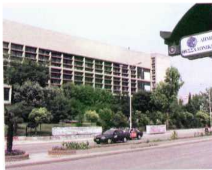
Το πανεπιστήμιο της Θεσσαλονίκης ιδρύθηκε τη δεκαετία του 1920.

Η κατάσταση στη δημοτική εκπαίδευση περιγράφεται στην επίσημη στατιστική του έτους 1938-39 ως εξής: 74.392 παιδιά διέκοπταν τη φοίτηση από το σχολείο οριστικά, διαρρέοντας από τάξη σε τάξη. Το 60,4% του συνόλου των δημοτικών σχολείων ήταν μονοτάξια, γεγονός που φανέρωνε ότι μεγάλο μέρος των Ελληνοπαίδων λάμβανε στοιχειωδέστατη μόρφωση. Την ίδια χρονιά, πάνω από 100.000 παιδιά σχολικής ηλικίας δημοτικού δεν φοιτούσαν στο σχολείο. Σε πάνω από 3.000 οικισμούς και συνοικισμούς δεν υπήρχε δημοτικό σχολείο. Τα υπάρχοντα νηπιαγωγεία εξυπηρετούσαν, την ίδια χρονιά, μόλις το 15% των παιδιών νηπιακής ηλικίας. Στη μέση εκπαίδευση επικρατούσε πραγματική σύγχυση. Υπήρχε μια πολυτυπία σχολείων που ιδρύθηκαν την περίοδο 1936-39 από το καθεστώς της 4ης Αυγούστου 1936 (δικτατορία Μεταξά), όπως το αιιικόν σχολείον (5 έτη), το προγυμνάσιον (5 έτη), το κλασικόν γυμνάσιον (8 έτη), το πρακτικόν λύκειον (8 έτη) κλπ.