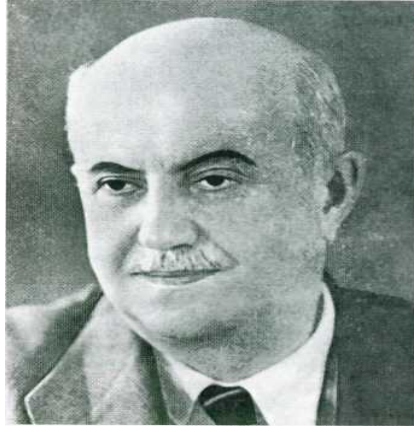
Ο νομικός και πολιτικός Αλέξανδρος Σβώλος (φωτ. από την έκδ. «100+1 χρόνια Ελλάδα»).