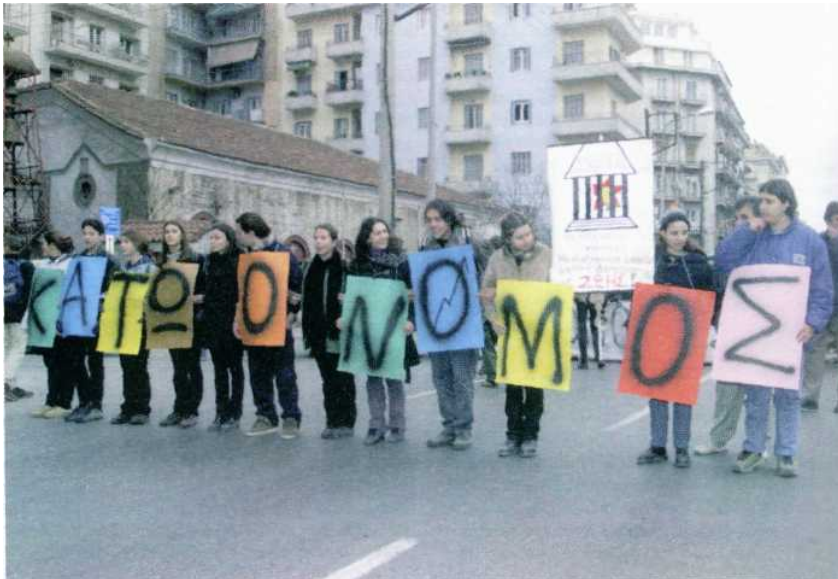
συχνές μαθητικές κινητοποιήσεις.

Μέσα στο ίδιο έτος θεσμοθετήθηκε με τον νόμο 2333/95 η Εθνική Διακομματική Επιτροπή Παιδείας. Με τον νόμο 2327/95 ιδρύθηκε το Εθνικό Συμβούλιο Παιδείας (ΕΣΥΠ) και το Κέντρο Εκπαιδευτικής Έρευνας (ΚΕΕ). Με τον νόμο 2413/96 («Η ελληνική παιδεία στο εξωτερικό, η διαπολιτισμική εκπαίδευση και άλλες διατάξεις»), ρυθμίζονταν θέματα της ελληνικής παιδείας στο εξωτερικό, ιδρύθηκε το Ινστιτούτο Παιδείας Ομογενών και Διαπολιτισμικής Εκπαίδευσης και οριοθετήθηκαν ο σκοπός και το περιεχόμενο της διαπολιτισμικής εκπαίδευσης. Τον Οκτώβριο του 1996 το ΠΑΣΟΚ ήταν ο νικητής της εκλογικής αναμέτρησης και σχημάτισε κυβέρνηση με πρωθυπουργό τον Κώστα Σημίτη· τη θέση του υπουργού Παιδείας κατέλαβε ο Γεράσιμος Αρσένης. Την 20ή Ιανουαρίου 1997 οι καθηγητές άρχισαν μια από τις μεγαλύτερες σε έκταση και ένταση απεργίες, που διήρκεσε μέχρι τις 14 Μαρτίου του ίδιου έτους. Σε ανοιχτή επιστολή της ΟΛΜΕ (19 Φεβρουαρίου 1997), η οποία φάνηκε να εκφράζει την ουσία της κινητοποίησης των εκπαιδευτικών, επισημάνθηκε, ανάμεσα σε άλλα, ότι «ο απεργιακός αγώνας δεν έχει