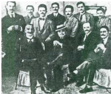
Οι κατηγορούμενοι για τα επεισόδια, γνωστά ως «Αθεϊκά», στη δίκη που πραγματοποιήθηκε στο Ναύπλιο τον Απρίλιο του 1914.

Λίγα χρόνια αργότερα, μέσα στην ίδια δεκαετία (1917), από την προσωρινή κυβέρνηση της Θεσ-σαλονίκης (υπό τον Ελευθέριο Βενιζέλο) και με εισήγηση του Δημήτριου Γληνού, νομοθετήθηκαν με διάταγμα (ν. 827/1917) και επικυρώθηκαν από τη Βουλή των Ελλήνων σχεδόν όλα όσα προβλέπονταν, όσον αφορά τη διάρθρωση του εκπαιδευτικού συστήματος, στα νομοσχέδια του 1913. Πα το δημοτικό σχολείο γράφτηκαν και κυκλοφόρησαν μέσα στη διετία 1917-19 δέκα νέα αναγνωστικά στη δημοτική, ανάμεσα τους τα περίφημα Ψηλά Βουνά και το Αλφαβητάρι με τον ήλιο , όλα γραμμένα με βάση τη γραμματική του Μανόλη Τριανταφυλλίδη. Τα νέα βιβλία ήταν γραμμένα στη λογική μιας παιδαγωγικής προοδευτικής και αντιαυταρχικής, χωρίς ηθικολογίες, διδακτισμούς και αφορισμούς. Οι μεταρρυθμίσεις του 1913 (εκείνη του 1913 δεν