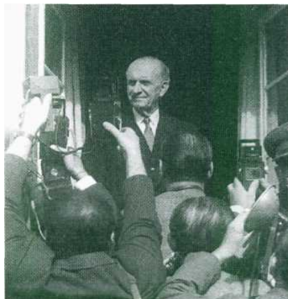
Ο Γεώργιος Παπανδρέου, με την εκπαιδευτική μεταρρύθμιση του 1964, κατοχύρωσε την δωρεάν παιδεία στην Ελλάδα.

Με το Βασιλικό διάταγμα 827/65, «Περί του κανονισμού λειτουργίας του Παιδαγωγικού Ινστιτούτου», ιδρύθηκε το Παιδαγωγικό Ινστιτούτο σε αντικατάσταση του Εκπαιδευτικού Συμβουλίου. Προβλεπόταν εξαετής δημοτικό σχολείο, ενώ η μέση εκπαίδευση διχοτομήθηκε σε δύο διαδοχικούς και αυτοτελείς τύπους σχολείων: το γυμνάσιο και το λύκειο. Η μετάβαση από το γυμνάσιο στο λύκειο γινόταν με εξετάσεις. Το λύκειο διαχωριζόταν στο γενικό λύκειο, στο τεχνικό επαγγελματικό λύκειο και στις σχολές εξειδίκευσης τεχνικών.