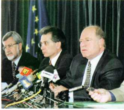
Ο Γεράσιμος Αρσένης, υπουργός Παιδείας την περίοδο 1996-2000, συνέδεσε το όνομα του με την ίδρυση του Ελληνικού Ανοιχτού Πανεπιστημίου το 1997.

Στις εξετάσεις της Β' Λυκείου του 1999 απορρίφθηκε το 30% των μαθητών, ποσοστό πρωτόγνωρο για τα δεδομένα της ελληνικής εκπαίδευσης. Τον επόμενο χρόνο το σύστημα προκάλεσε νέες αντιδράσεις, καθώς κατασκεύασε τεχνητά 11.500 αριστούχους, η συντριπτική πλειονότητα των οποίων δεν κατάφερε να πετύχει την είσοδο της στις σχολές που είχε επιλέξει με πρώτη προτίμηση.