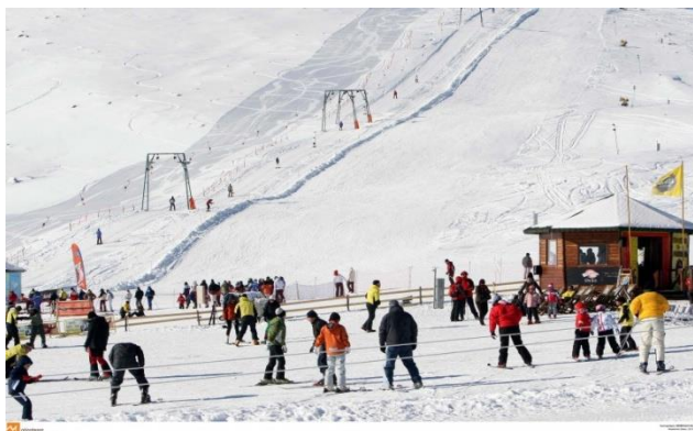
Εικόνα_: Τουρισμός Χειμερινών Σπορ.

Ο τουρισμός χειμερινών σπορ είναι ευρέως διαδεδομένη για τη δυναμική μορφή του, πολλές χώρες υποδοχής και φιλοξενίας τουριστών προσπαθούν να αναπτυχθούν μέσω αυτής της μορφής. Γίνονται προσπάθειες να αξιοποιηθούν τους αδρανείς μήνες του χειμώνα ώστε να προσελκύσουν διάφορες κατηγορίες τουριστών και κυρίως άτομα υψηλής εισοδηματικής στάθμης 9 .