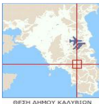
ΘΕΣΗ ΔΗΜΟΥ ΚΑΛΥΒΙΩΝ

Οι ορεινοί όγκοι που βρίσκονται στα διοικητικά όρια της δημοτικής κοινότητας είναι το Πάνειο Όρος (Πανί), η Αιματόριζα (Μερέντα, Ριζαγκιάκου) και ο Λαυρεωτικός Όλυμπος (Σκόρδι). Από την περιοχή Στρογγύλι μέχρι την παραλία του Λαγονησίου εκτείνονται οι λόφοι Καμάριζα, Τίποτι, Πρόι-Λιόπεσι, Μάλιε-Κούκιες, Αγία Τριάδα- Μπόσκιζα και Ξελαυτάκι. Η έξοδος της δημοτικής κοινότητας προς τη θάλασσα, η παραλία του, έχει μήκος 7 περίπου χιλιόμετρα. Είναι ομαλή και προσβάσιμη και μερικώς αξιοποιημένη. Περιλαμβάνει τις περιοχές Λαγονήσι, Θέρμη, Κιτέζα, Λυκουρίζα, Άγιος Νικόλαος, Γαλάζια Ακτή-Χιερώμες και τμήμα του Αγίου Δημητρίου. Οι κύριες χρήσεις γης εντός των ορίων της δημοτικής κοινότητας είναι οι εξής: κατοικία περίπου 10.000 στρέμματα, γεωργική χρήση περίπου 35.000 στρέμματα, δάση και δασικές εκτάσεις περίπου 25.000 στρέμματα και βιοτεχνική-βιομηχανική περίπου 2.000 στρέμματα (saronikocity).