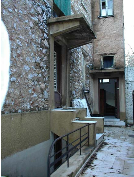
Εικ. 9 Η είσοδος που οδηγούσε στην στάθμη του Ισογείου και οι σκάλες του Υπογείου.