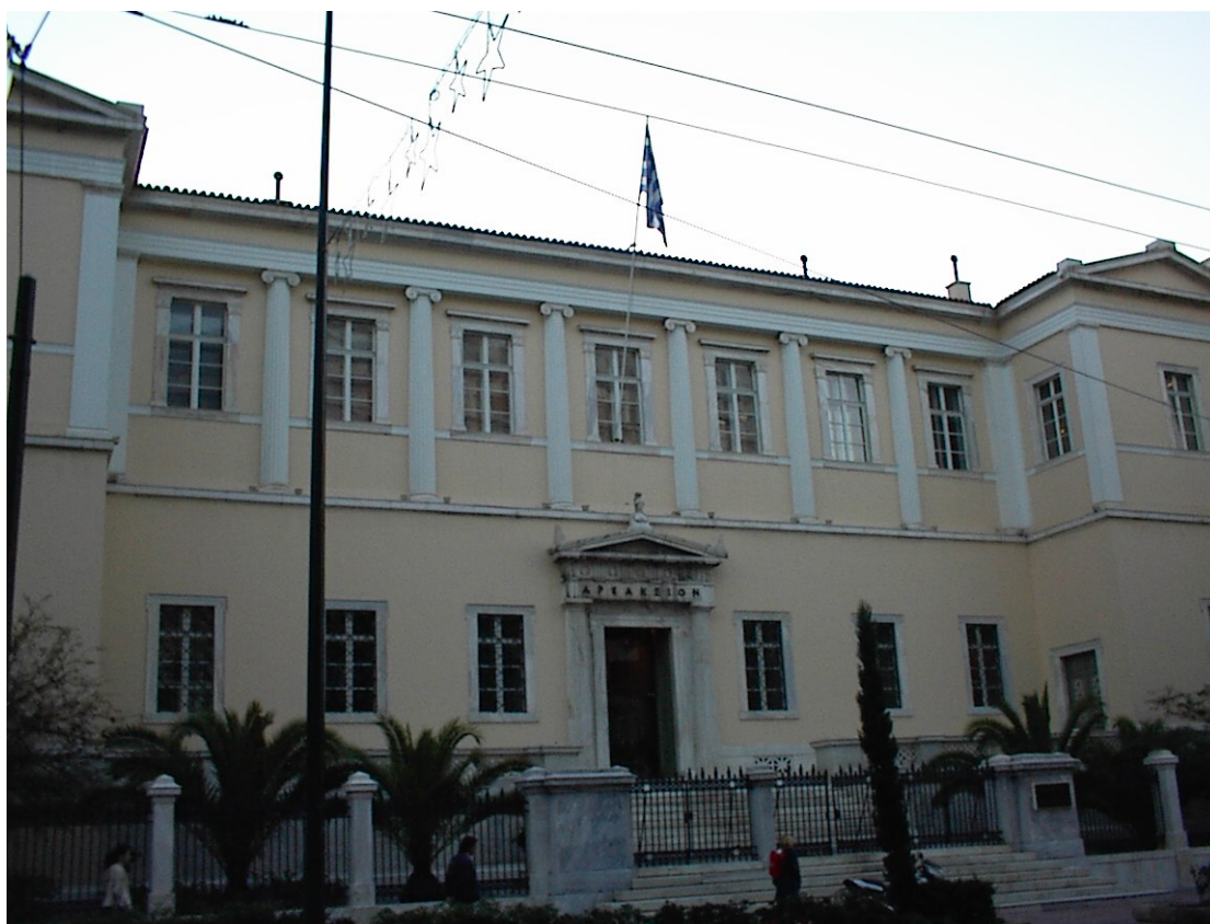
Εικ. 3 Το Αρσάκειο

προτύπων και πατριωτικής λατρείας των αρχαίων προγόνων μόνον, αποκλείοντας τους βυζαντινούς.