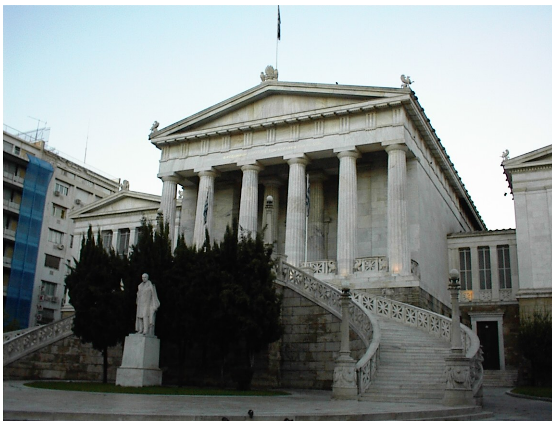
Εικ. 2 Εμφανή χαρακτηριστικά δανεισμένα από τα αρχαία πρότυπα.