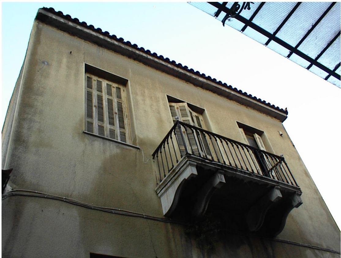
Εικ. 11 Τα τετραγωνισμένα φουρούσια τείνουν προς τον κλασικισμό και όχι προς μία πιο ρομαντική άποψη.