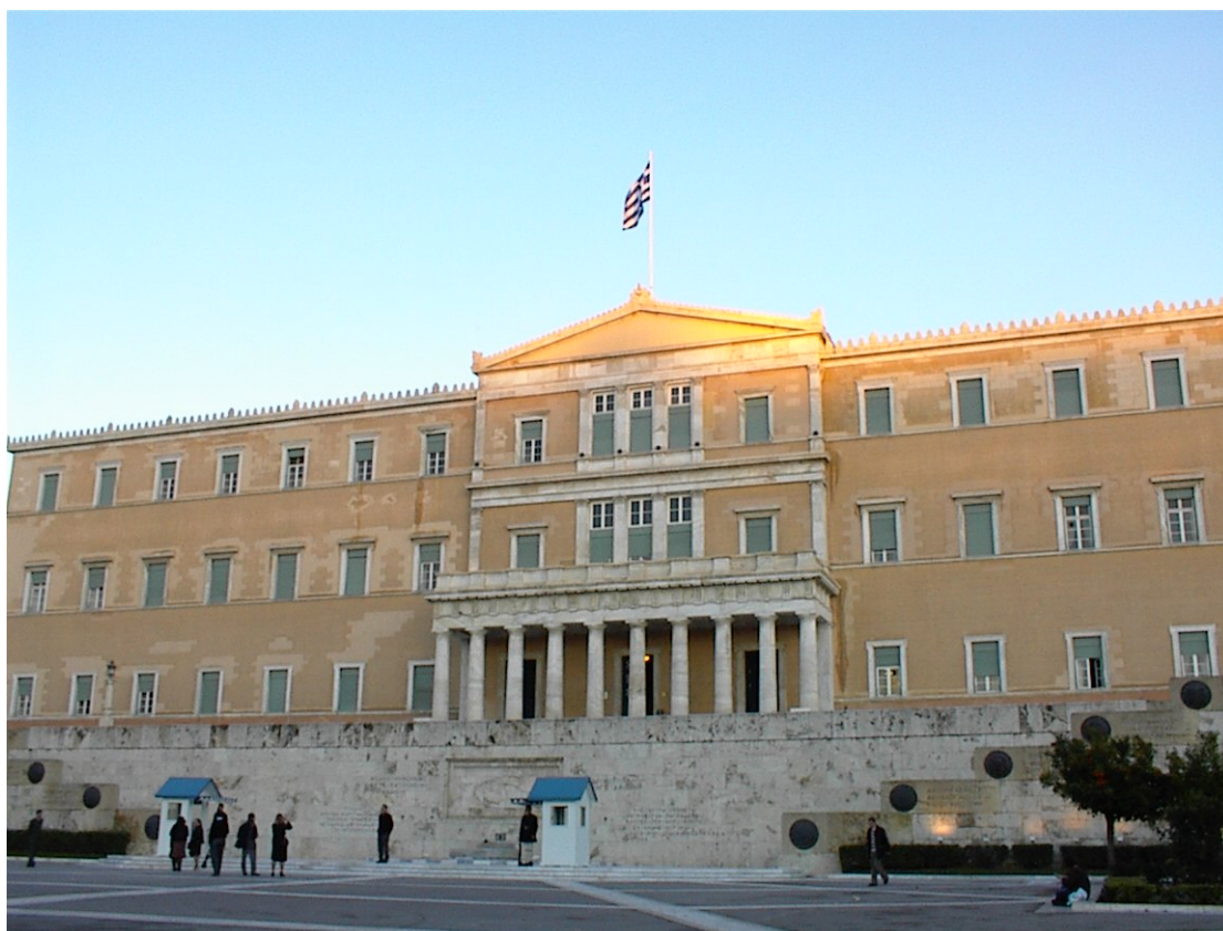
Εικ. 1: Το πιο χαρακτηριστικό νεοκλασικό κτίσμα στο κέντρο της Αθήνας, το Σύνταγμα.