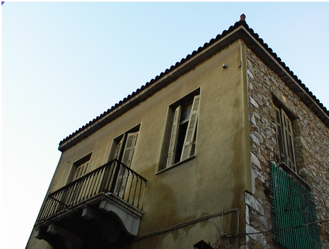
Εικ. 10 Διαμόρφωση της πρόσοψης «έσβησε» όλα εκείνα τα χαρακτηριστικά που χαρακτηρίζουν ένα νεοκλασικό.