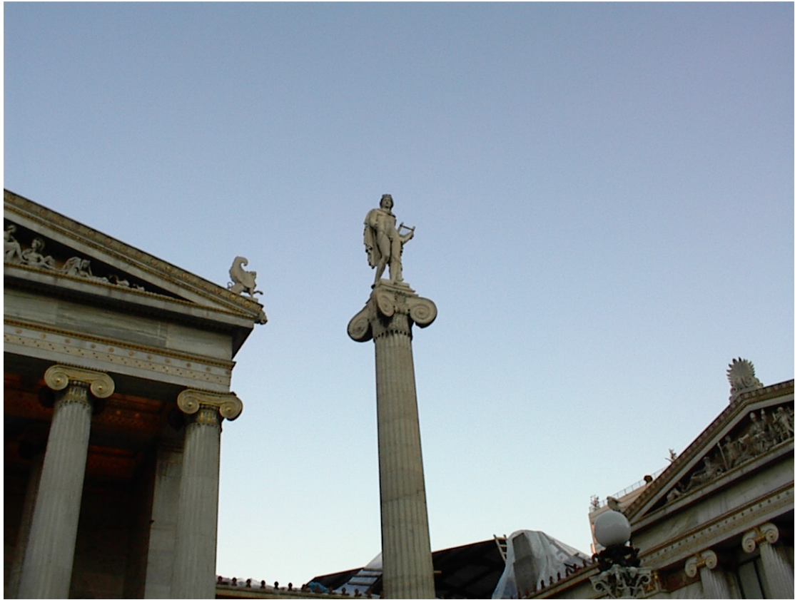
Εικ. 4, 5, 6 Μετώπες, Ακροκέραμα και αγάλματα εμπνευσμένα από την αρχαία Ελλάδα στολίζουν τα πιο εντυπωσιακά νεοκλασικά.