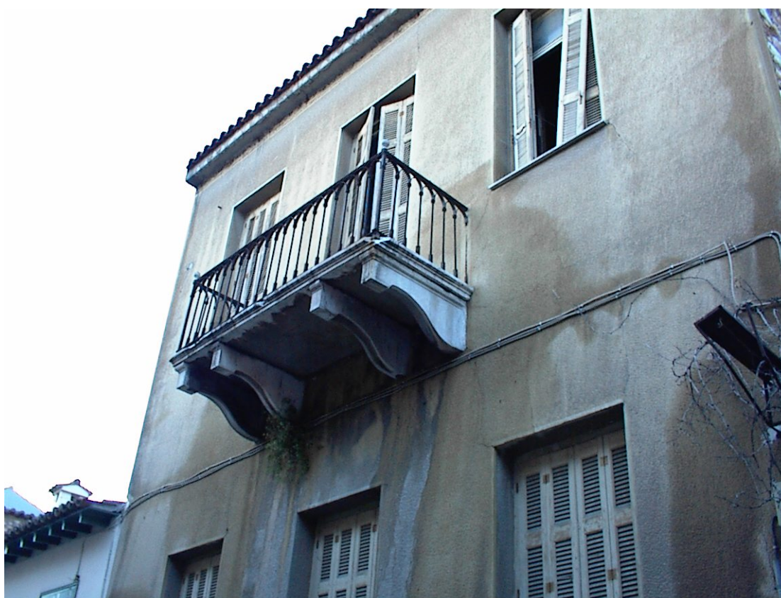
Εικ. 7, 8 Ένα από τα λίγα στοιχεία του νεοκλασικισμού που διατηρούνται ακόμα στο διατηρητέο μας: τα κιγκλιδώματα της εισόδου και του εξώστη.