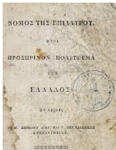
Σύνταγμα του Άστρους του 1823, γνωστό και ως «Νόμος της Επιδαύρου»

Στον ελλαδικό χώρο, ωστόσο πολλοί πεφωτισμένοι, μέσα από τα διάφορα έργα τους προσπαθούσαν να περάσουν στις συνειδήσεις των Ελλήνων, το δικαίωμα ελευθερίας του λόγου, της σκέψης και της έκφρασης. Στα ελληνικά Συντάγματα, διακηρύχθηκε η ελευθερία του τύπου, στο συνταγματικό σχέδιο του πρωτοπόρου τότε Ρήγα Βελεστίνη με το άρθρο 'Η του Συντάγματος του Άστρους του 1823 γνωστό και ως "Νόμος της Επιδαύρου", όπου έλεγε χαρακτηριστικά: «Οι Έλληνες έχουν το δικαίωμα να κοινοποιώσιν άλλως τε και δια των τύπων τας δοξασίας των, αλλά με τους ακόλουθους τρεις όρους: α' – Να μη γίνεται λόγος κατά της χριστιανικής θρησκείας, β' - Να μην αντιβαίνωσιν εις τας κοινώς αποδεδειγμένας αρχάς της ηθικής, γ' - Να αποφεύγωσι πάσαν προσωπικήν ύβριν» 3 . Το οποίο επέτρεπε στους Έλληνες να κοινοποιούν μεταξύ άλλων και δια του τύπου την γνώμη τους, χωρίς να θίγουν την χριστιανική θρησκεία και αποφεύγοντας προσωπικές ύβρεις.