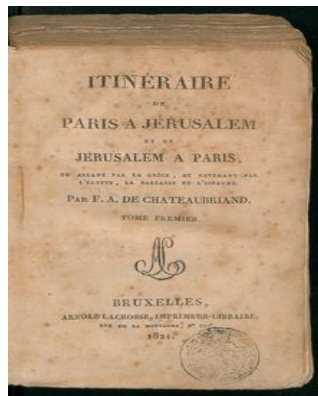
Itinéraire de Paris à Jérusalem et de Jérusalem à Paris

Από εκείνη την περίοδο και μετά ο τύπος υπέστη πολλές αλλαγές, όπως ιδεολογικές, οικονομικές και τεχνικές και ταυτόχρονα εξελίχθηκε στη μορφή και στη δομή του. Την περίοδο εκείνη λοιπόν, το γνωστό τότε τετρασέλιδο ή δισέλιδο άρχισε να μεγαλώνει και να μοιράζεται σε πιο πολλούς ανθρώπους όλων των τάξεων και οι επιχειρήσεις ακόμα άρχισαν να απασχολούν μεγαλύτερο αριθμό ανθρώπων. Ο τύπος από την εποχή των αρχικών διακηρύξεων της ελευθερίας του, υπέστη πολλές μεταβολές όπως, τεχνικές, οικονομικές κλπ. Πλέον, έτσι κι αλλιώς δεν είναι το μόνο μέσο με το οποίο μπορεί κανείς να ενημερωθεί, είναι και η τηλεόραση και το ραδιόφωνο αλλά και το διαδίκτυο, το οποίο στις μέρες μας θα μπορούσε να πεί κανείς πως είναι το κυριότερο μέσο μαζικής ενημέρωσης. Ιστορικά ελευθερία του τύπου σημαίνει, ελευθερία του πολιτικού τύπου από τον κρατικό έλεγχο που υπήρχε τότε σε αρκετά μεγάλο βαθμό. Εκεί λοιπόν, υπήρχε και αλλαγή της ελευθερίας του τύπου ως φιλελεύθερο ατομικό δικαίωμα σε ένα δημοκρατικό πολιτικό δικαίωμα του κάθε πολίτη.