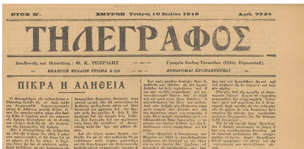
Εξώφυλλο εφημερίδας της Σμύρνης το έτος 1919

Όλο αυτό το διάστημα ο τύπος, υπέστη βαθιές αλλαγές. Ακόμη και ο κύκλος των αναγνωστών του άλλαξε ποσοτικά και ποιοτικά. Σήμερα πολλοί διαβάζουν εφημερίδες, ωστόσο όμως δεν πρόκειται για το κύριο μέσο μαζικής επικοινωνίας και ενημέρωσης αφού η ραδιοφωνία, η τηλεόραση και το διαδύκτιο έχουν λάβει τεράστιες διαστάσεις για την φιλελεύθερη δημοκρατία.