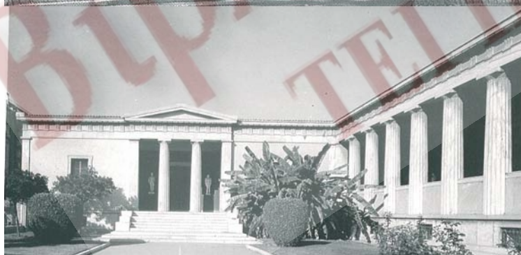
Στοά και προπύλαιο από την βόρεια πλευρά του Πολυτεχνείου