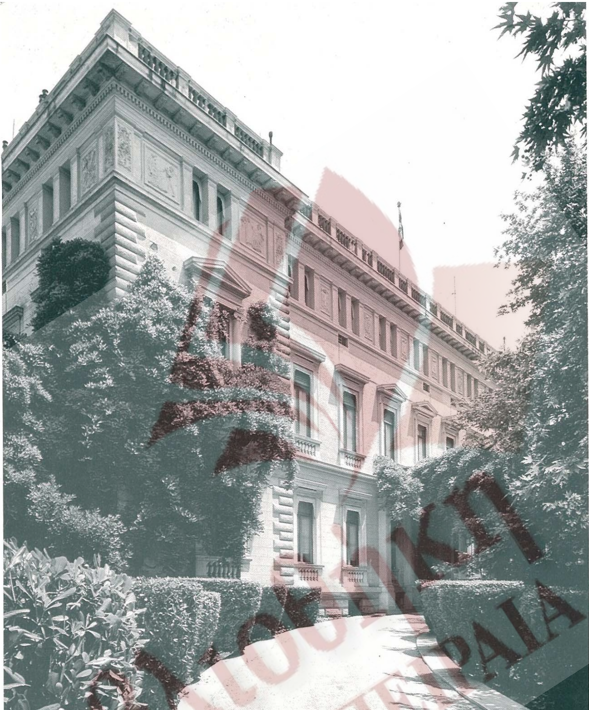
Τα ανάκτορα στην οδό Ηρώδου του Αττικού , 1890 Αρχιτέκτων Ε.Τσίλλερ