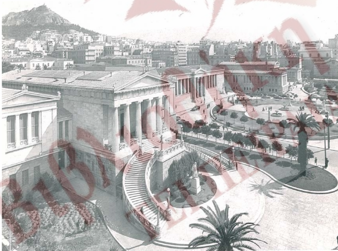
Η Αθηναϊκή τριλογία Βιβλιοθήκη, Πανεπιστήμιο, Ακαδημία,