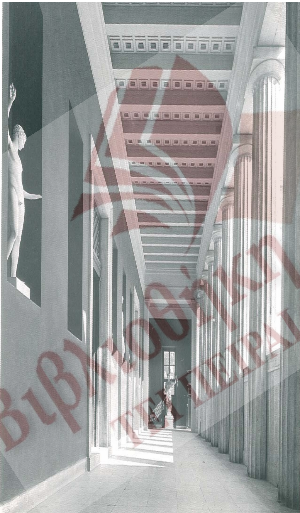
Εσωτερικό της στοάς