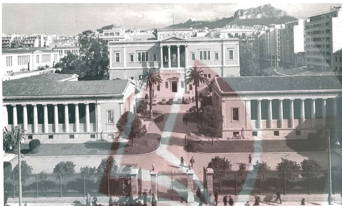
Το Μετσόβιο Πολυτεχνείο .Θεμελιώθηκε το1862 και τελίωσε το 1876.Αρχιτέκτων Λυς.Καυτητζόγλου