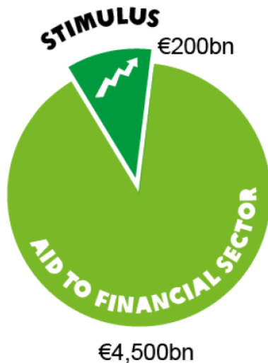
Εικόνα 1. Πακέτα Τόνωσης και Πακέτα Διάσωσης

Το 2010, πολλές ευρωπαϊκές κυβερνήσεις έληξαν την επεκτατική πολιτική τους και ξεκίνησαν μια σειρά μέτρων λιτότητας. Ορισμένες χώρες, όπως η Ελλάδα, η Ισπανία, η Ιρλανδία και η Πορτογαλία όφειλαν να λάβουν μέτρα λιτότητας σύμφωνα με τους όρους των συμφωνιών διάσωσης τους από την Ευρωπαϊκή Κεντρική Τράπεζα, την Ευρωπαϊκή Επιτροπή και το Διεθνές Νομισματικό Ταμείο (ΔΝΤ). Άλλοι, όπως το Ηνωμένο Βασίλειο, επέλεξαν ελεύθερα να λάβουν μέτρα λιτότητας, επειδή τα θεωρούσε ως το καλύτερο μέσο για την αντιμετώπιση του υψηλού δημόσιου χρέους και των δημοσιονομικών ελλειμμάτων. Τα μέτρα λιτότητας περιλαμβάνουν διάφορες πολιτικές που εδραιώνουν την ανισότητα - από την απώλεια των αξιοπρεπών δημοσίων υπηρεσιών μέχρι τη διάβρωση της κοινωνικής ασφάλισης και την αποδυνάμωση των συλλογικών διαπραγματεύσεων με την απορρύθμιση της αγοράς εργασίας. Τα μέτρα αυτά, που αφορούν κυρίως αναδρομικούς φόρους και μεγάλες περικοπές δαπανών, είχαν σοβαρές επιδράσεις στις Ευρωπαϊκές κοινωνίες σε μία εποχή που οι περισσότερες χώρες υποφέρουν από υψηλά επίπεδα ανεργίας.