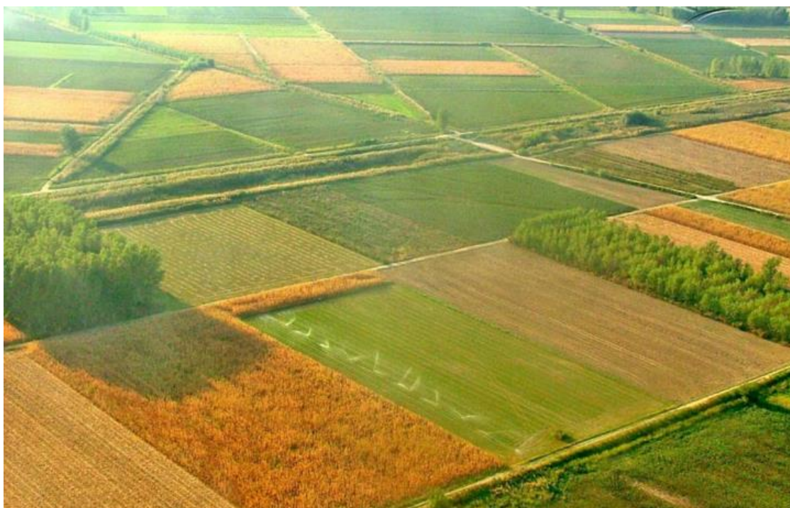
Τριτογενής τομέας στην Ήπειρο

Η περιφέρεια παράγει το 2.3% του συνολικού Α.Ε.Π (Ακαθάριστο Εγχώριο Προϊόν) της Χώρας με απασχόληση 17% στον πρωτογενή, 23% στον δευτερογενή και 60% στον τριτογενή τομέα. Παρατηρώντας τις τάσεις στην δομή της απασχόλησης βλέπουμε μια αύξηση της συμμετοχής στον τριτογενή τομέα και ειδικότερα στον τουρισμό. Αξίζει να σημειώσουμε, ότι το 50% των εμπορικών καταστημάτων, αλλά και των ανθρώπων, που απασχολούνται στον τριτογενή τομέα γενικά, βρίσκονται στον νομό Ιωαννίνων. 4