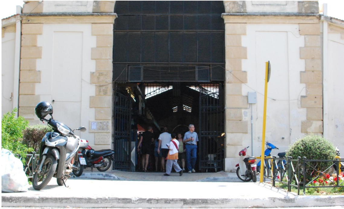
Εικ. 16 Δυτική είσοδος