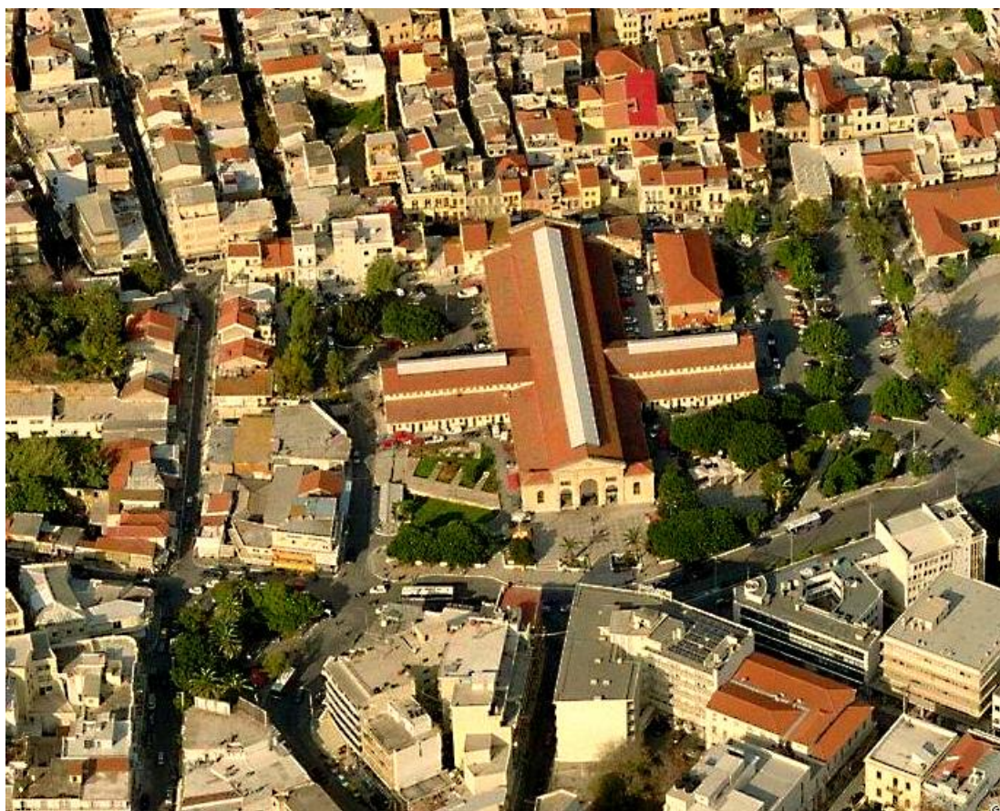
Εικ.13 Δορυφορική φωτογραφία της αγοράς