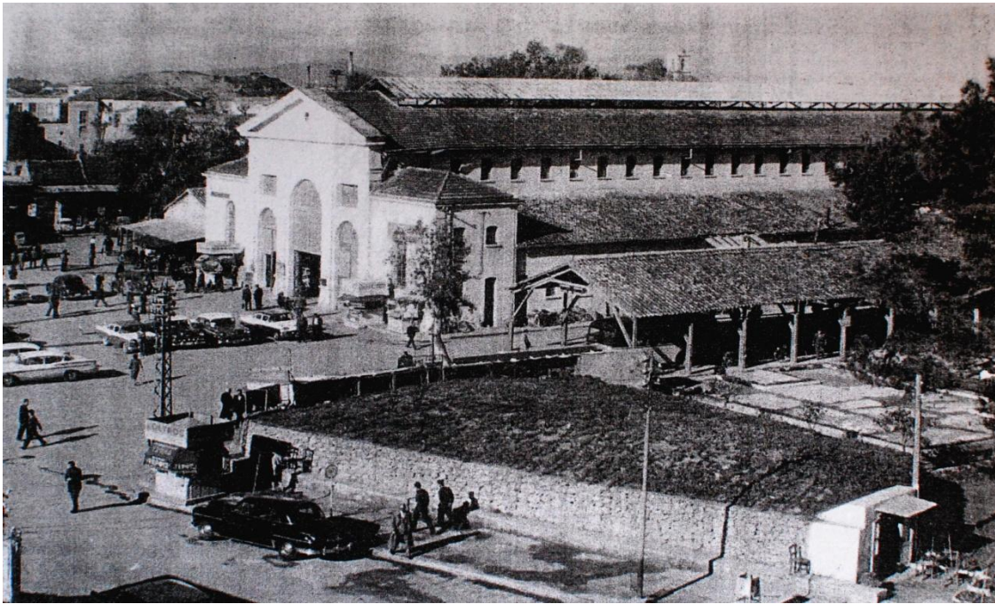
Εικ.11 Το αντιαεροπορικό καταφύγιο