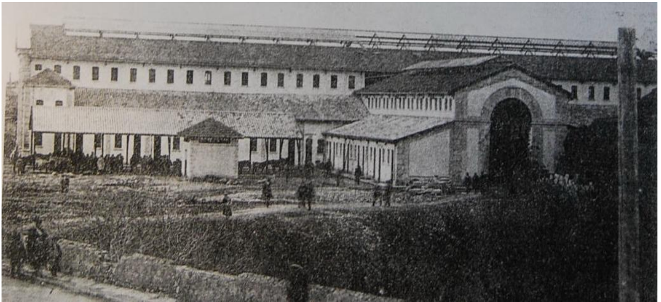
Εικ.7 Το ανατολικό υπόστεγο 1942