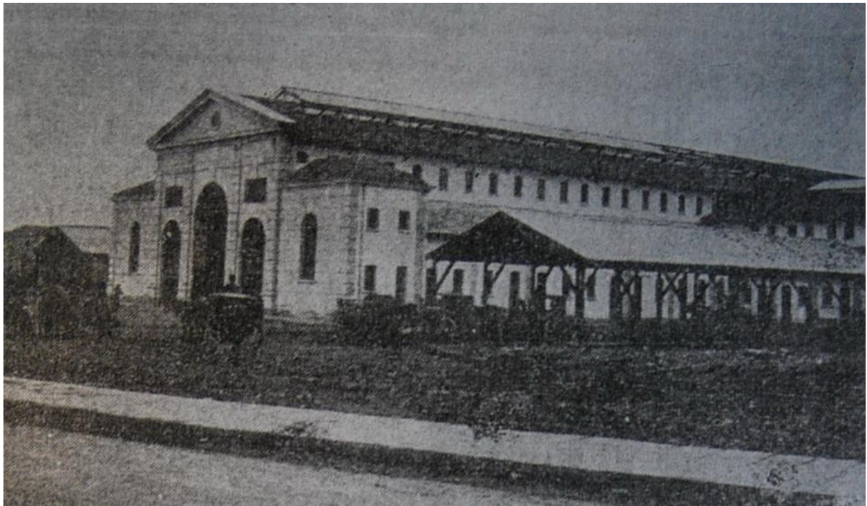
Εικ.8 Η ανατολική πλευρά πριν επιχωματωθεί