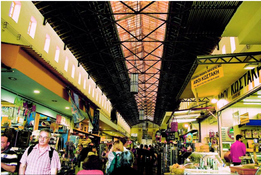
Εικ.4 Το εσωτερικό όπως φαίνεται από την νότια είσοδο