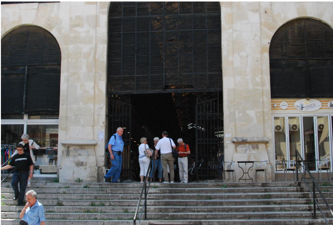
Εικ. 15 Η Βορεινή είσοδος