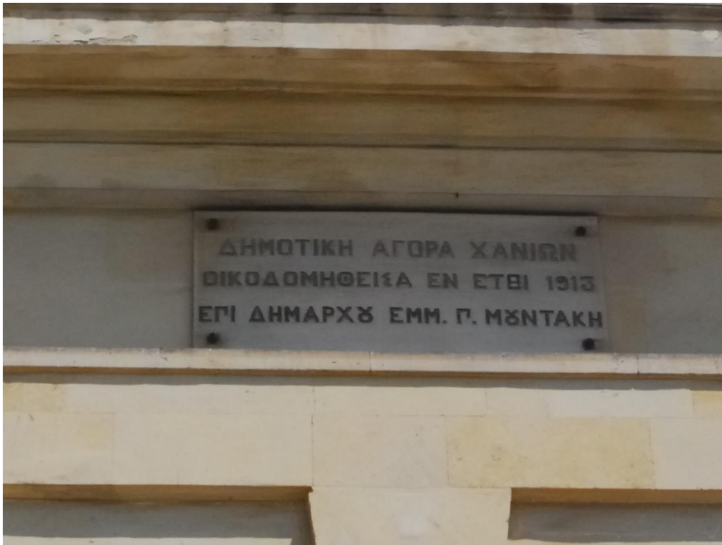
Εικ.10 Η πλάκα στην πρόσοψη της αγοράς