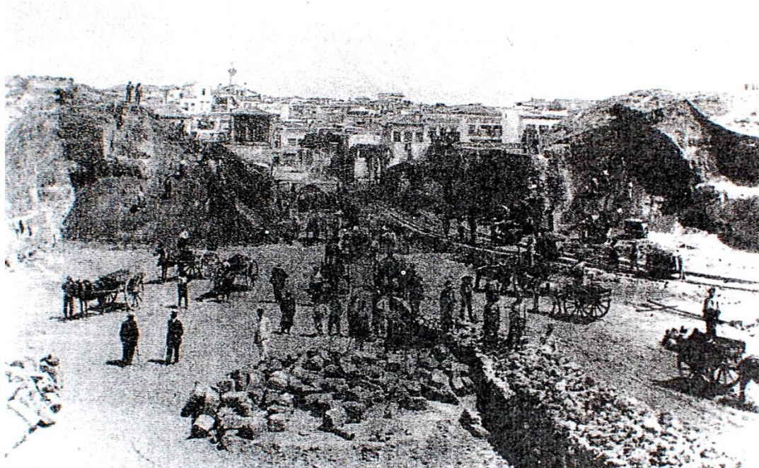
Εικ.12 Τα έργα θεμελίωσης