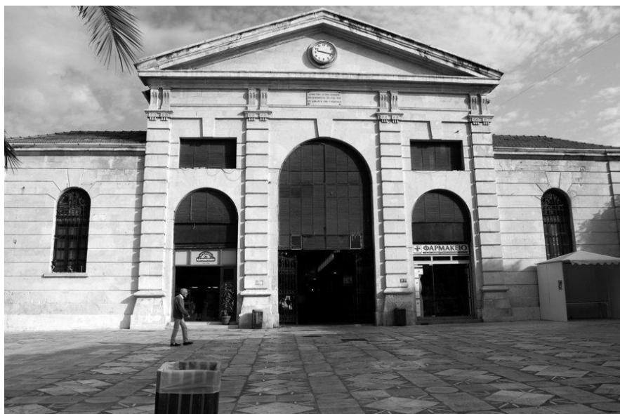
Εικ.3 Η πρόσοψη της αγοράς.