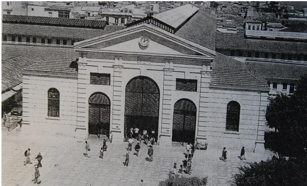
Εικ.5 Νότια (κεντρική) είσοδος 1965