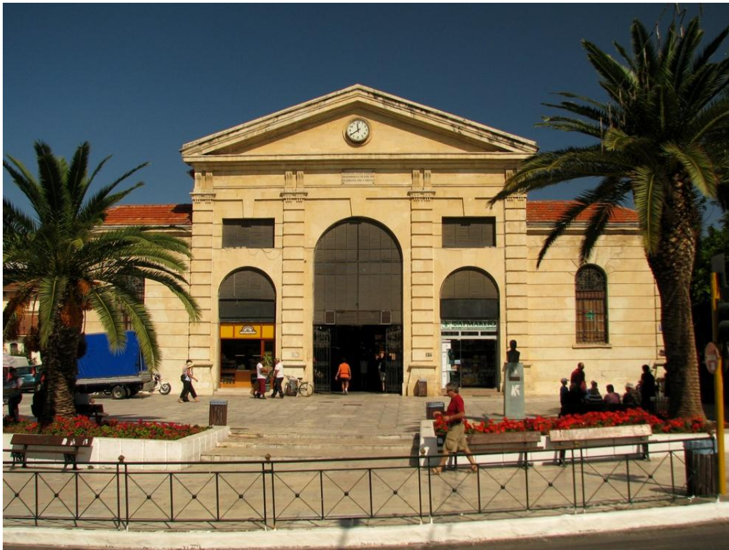
Εικ.2 Η αγορά σήμερα.