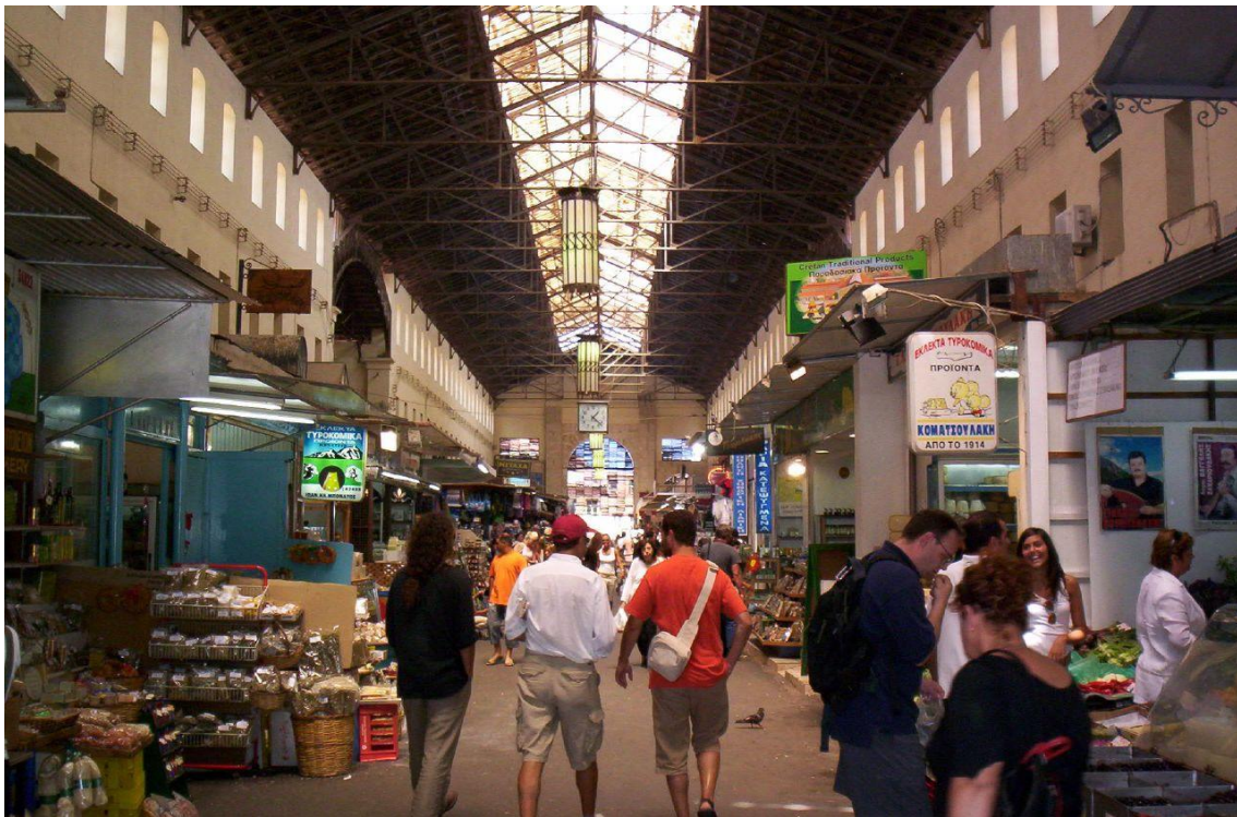
Εικ.9 Το εσωτερικό της αγοράς