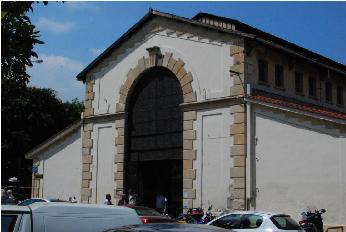
Εικ. 14 Ανατολική είσοδος