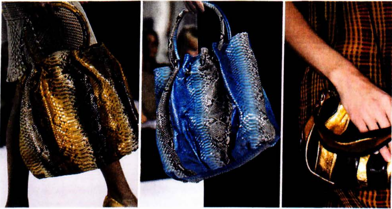
Oscar De La Renta

Να φροντίζετε πάντα η τσάντα σας να είναι σε χρωματική αντίθεση με το υπόλοιπο ντύσιμό σας.