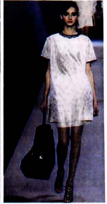
Viktor & Rolf

Εάν θέλετε πραγματικά να ακολουθήσετε πιστά τις νέες επιταγές, αξίζει να ρίξετε μια ματιά στις συλλογές των Ολλανδών σχεδιαστών Viktor & Rolf και να δείτε πώς χρησιμοποιούν το latex (ναι, διαβάζετε σωστά) στις πιο πρόσφατες συλλογές τους.