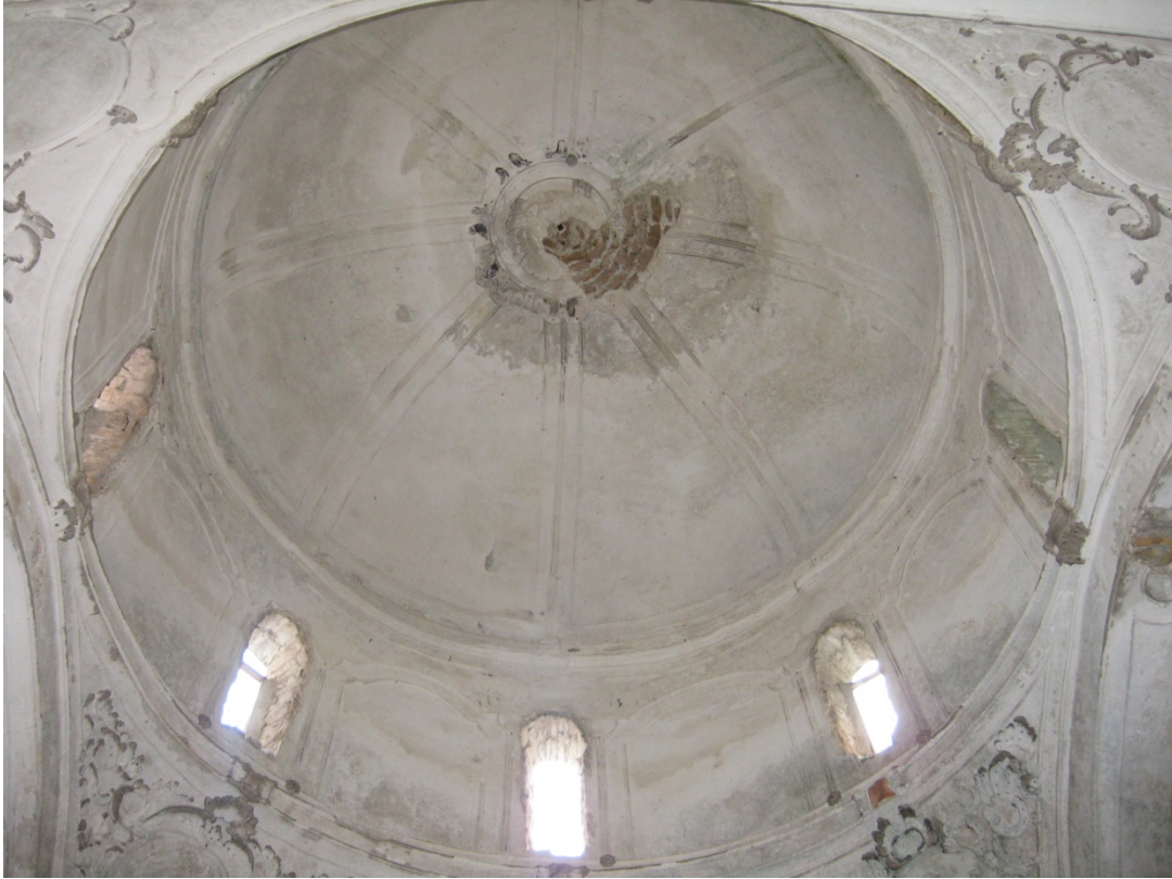
Εσωτερική όψη του τρούλλου του νοτίου Ναού (λήψη από τον κυρίως ναό)