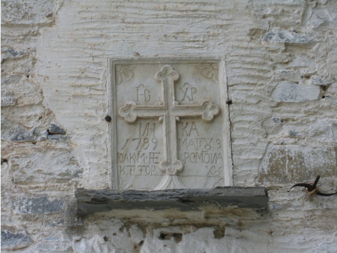
Μαρμάρινη πλάκα ύπερθεν της νοτίας πύλης εισόδου στο Ναό