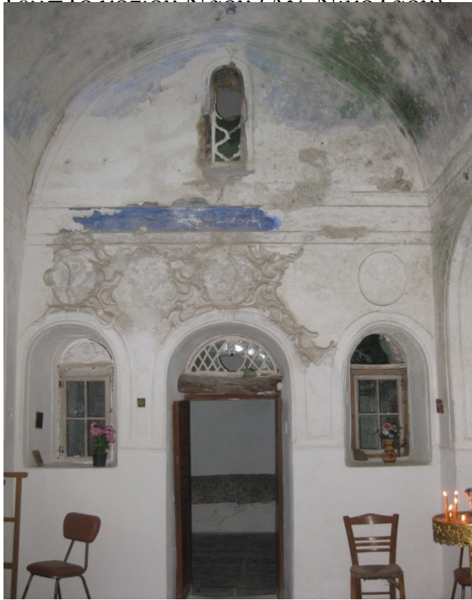
Διαχωριστικός τοίχος μεταξύ προνάου και νοτίου κυρίως Ναού (λήψη από τον κυρίως ναό)