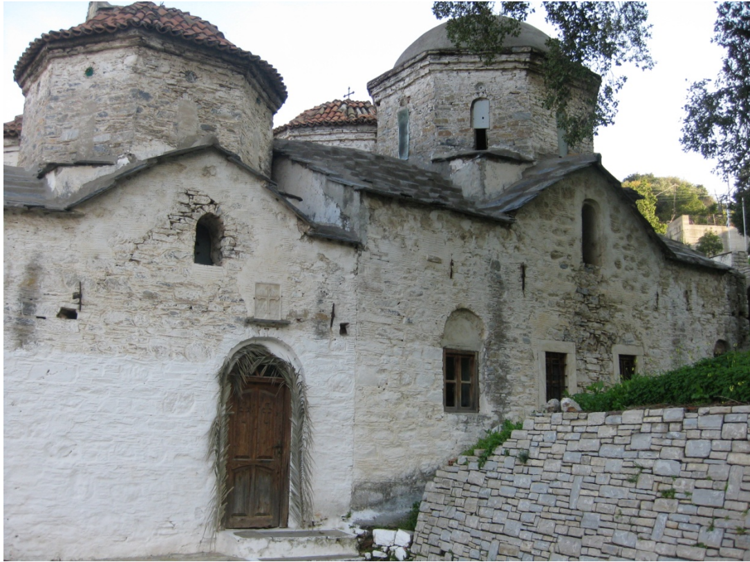
Ο Ναός με λήψη από τη νοτιοδυτική πλευρά