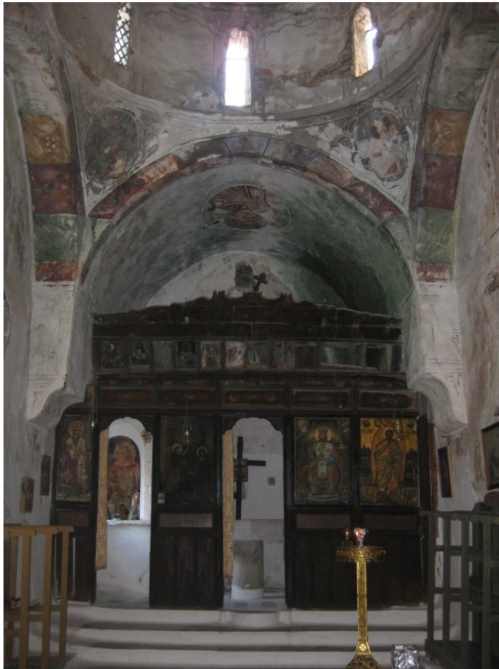
Τέμπλο νοτίου Ναού (Αγ. Ιωάννου)