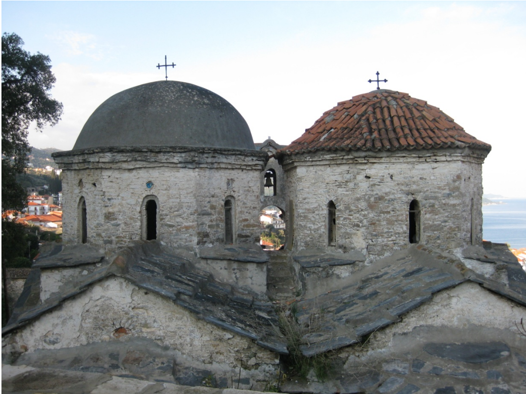
Οι δύο τρούλλοι των κυρίως Ναών (Λήψη από την ανατολική πλευρά)