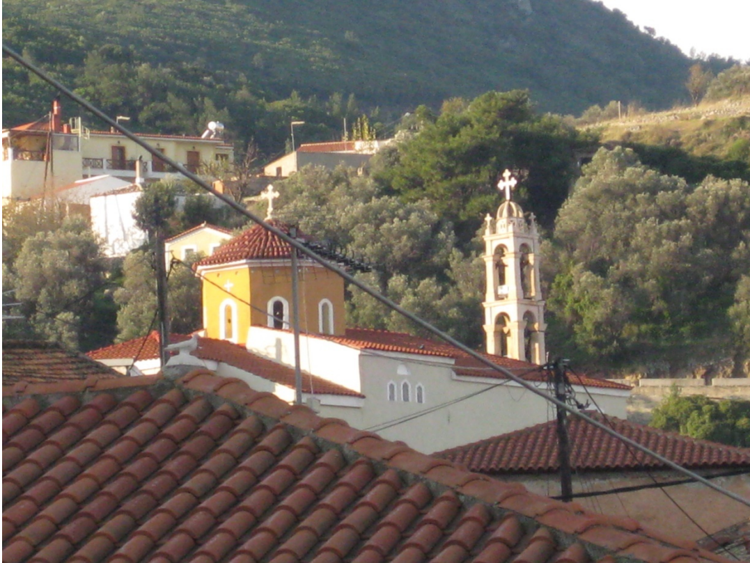
Ιερός Ναός Μεταμορφώσεως του Σωτήρος