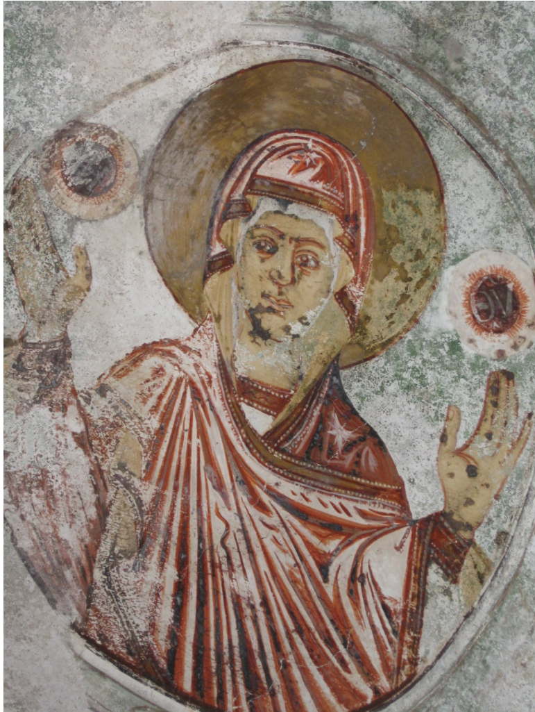
Η Παναγία Δεομένη (Τοιχογραφία-νότιος Ναός)