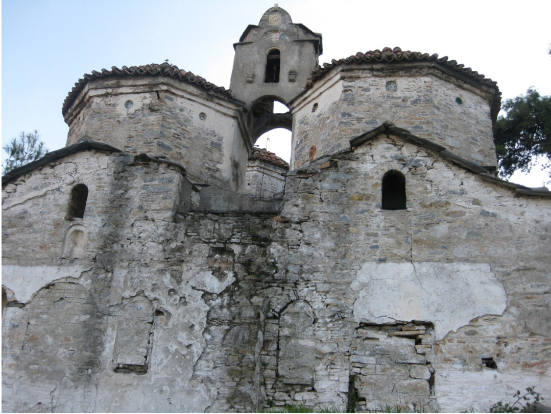
Οι τρούλλοι του Προνάου-Νάρθηκα (Λήψη από δυτικά)