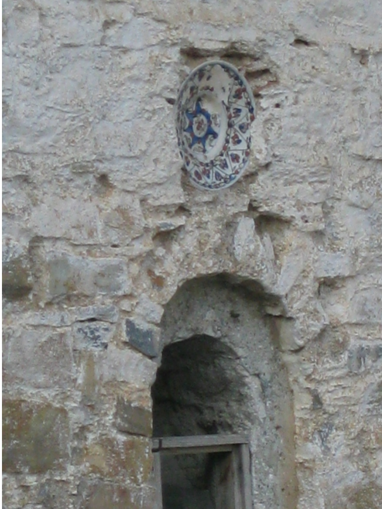
Διακοσμητικό πιάτο στον τρούλλο του νοτίου κυρίως Ναού