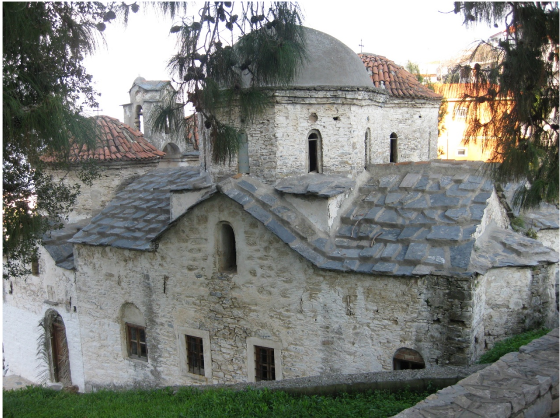
Νότια πλευρά του Ναού