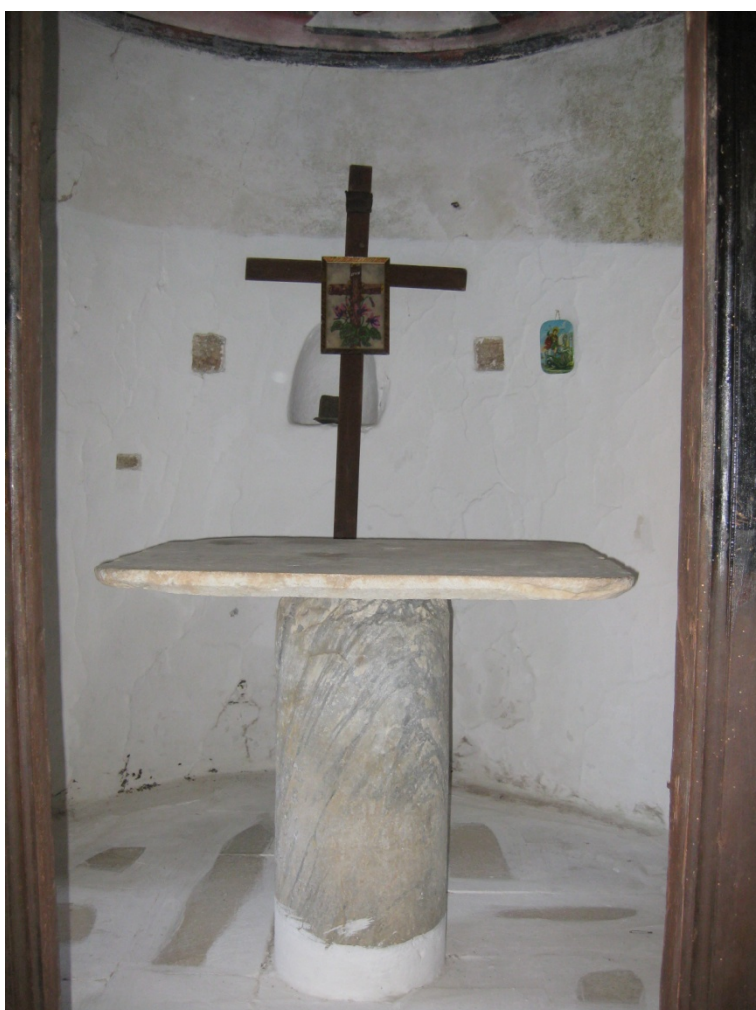
ος Ναών (θύρου)