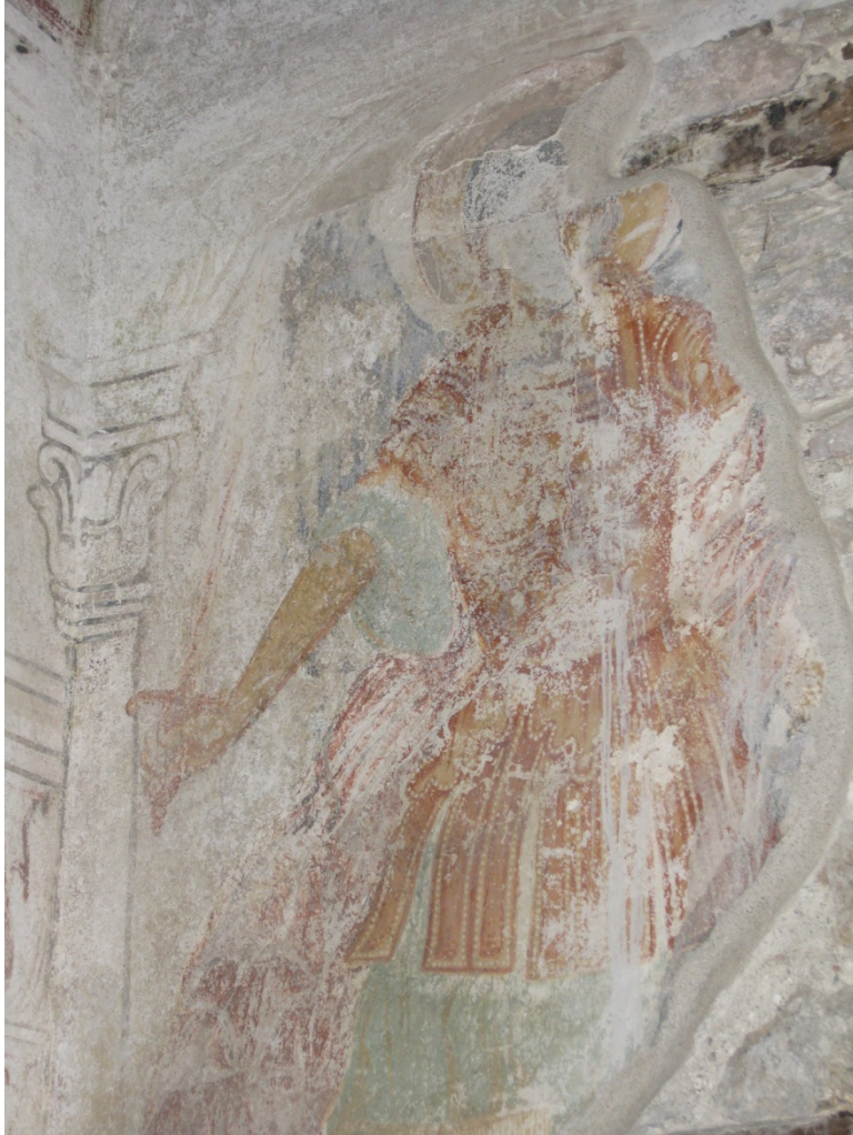
Ο Αρχάγγελος Μιχαήλ (τοιχογραφία-βόρειος Ναός)