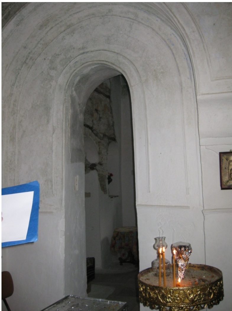
Διαχωριστικός τοίχος μεταξύ των δύο κυρίως Ναών (λήψη από το νότιο Ναό στην περιοχή της αμφίδρομης εισόδου)