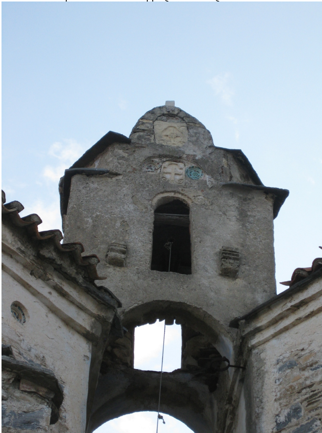
Το κωδωνοστάσιο (Λήψη από τη δυτική πλευρά)