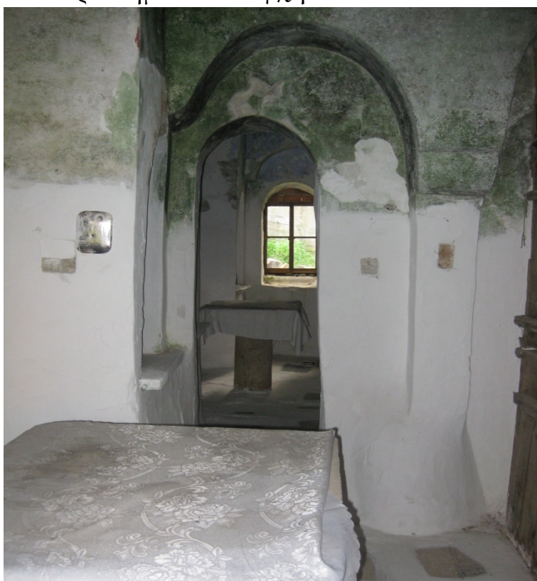
Ιερό Βήμα και κόγχη του νοτίου Ναού