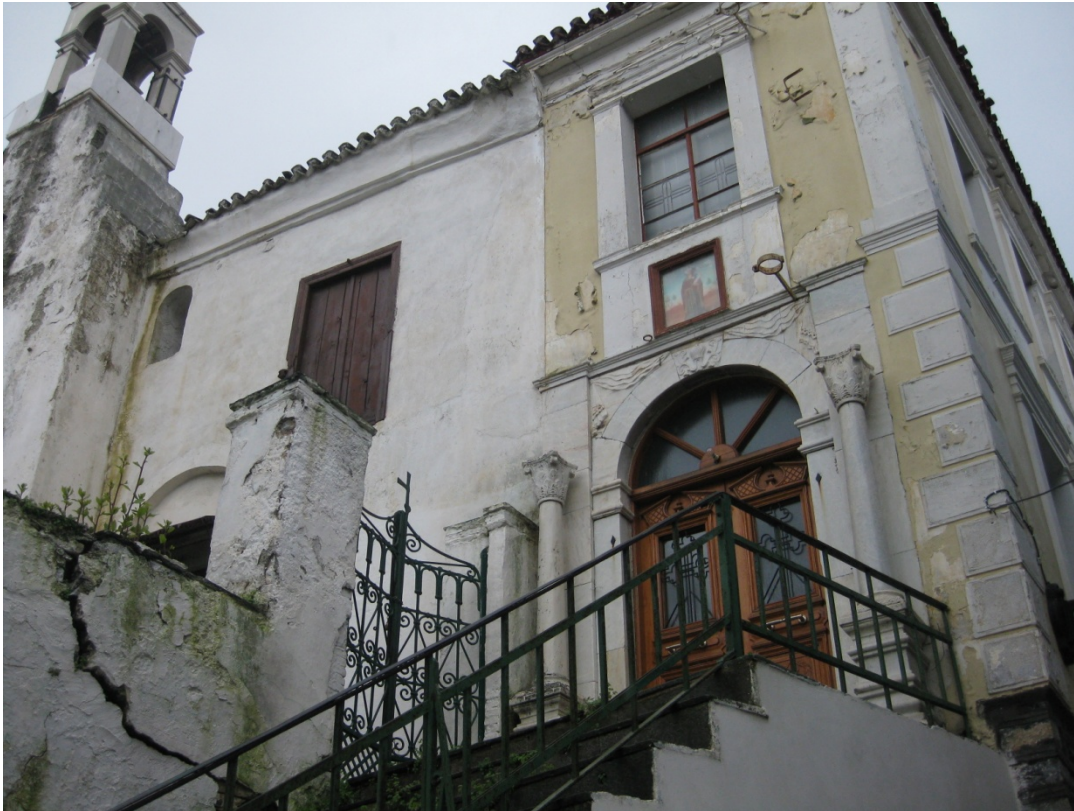
Ιερός Ναός Αγίου Αντωνίου