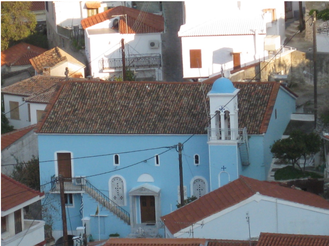
Ιερός Ναός Κοιμήσεως Θεοτόκου