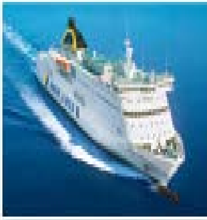
H/S/F Hellenic Spirit