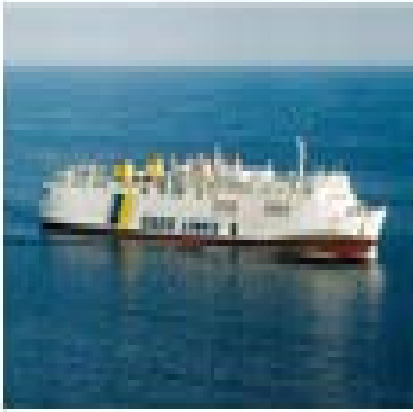
F/B Κρήτη II